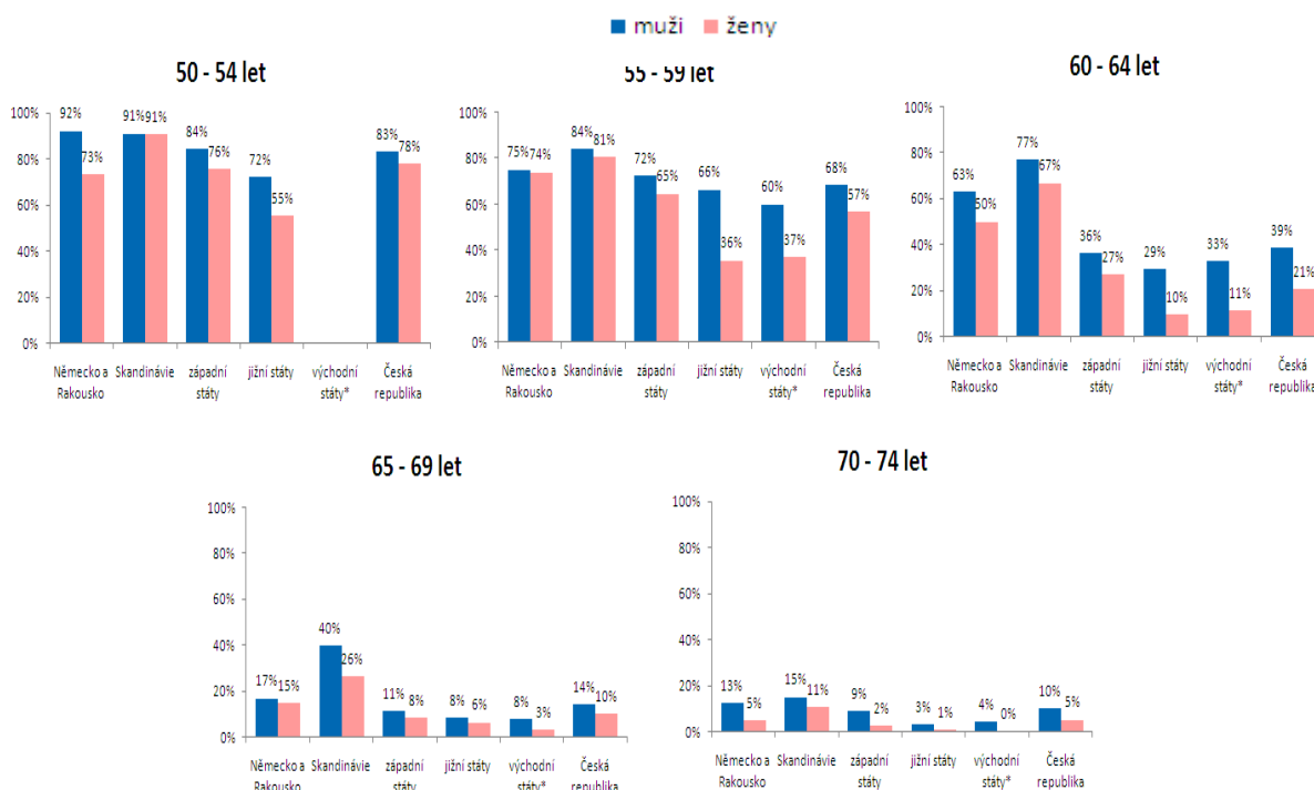
Grafy 1 – 5 Podíl pracujících v jednotlivých věkových kategoriích podle oblasti a pohlaví (*pozn. – pro kategorii 50 – 54 let nebylo dostatek relevantních dat)

Již přehledové grafy 1 až 5 ukazují, že skandinávské země vykazují ve všech sledovaných kategoriích vysokou míru zapojení osob do pracovního procesu. V kategorii 60 – 64 let pracují zhruba tři čtvrtiny obyvatel. U Němců a Rakušanů je to dvě třetiny mužů a polovina žen.