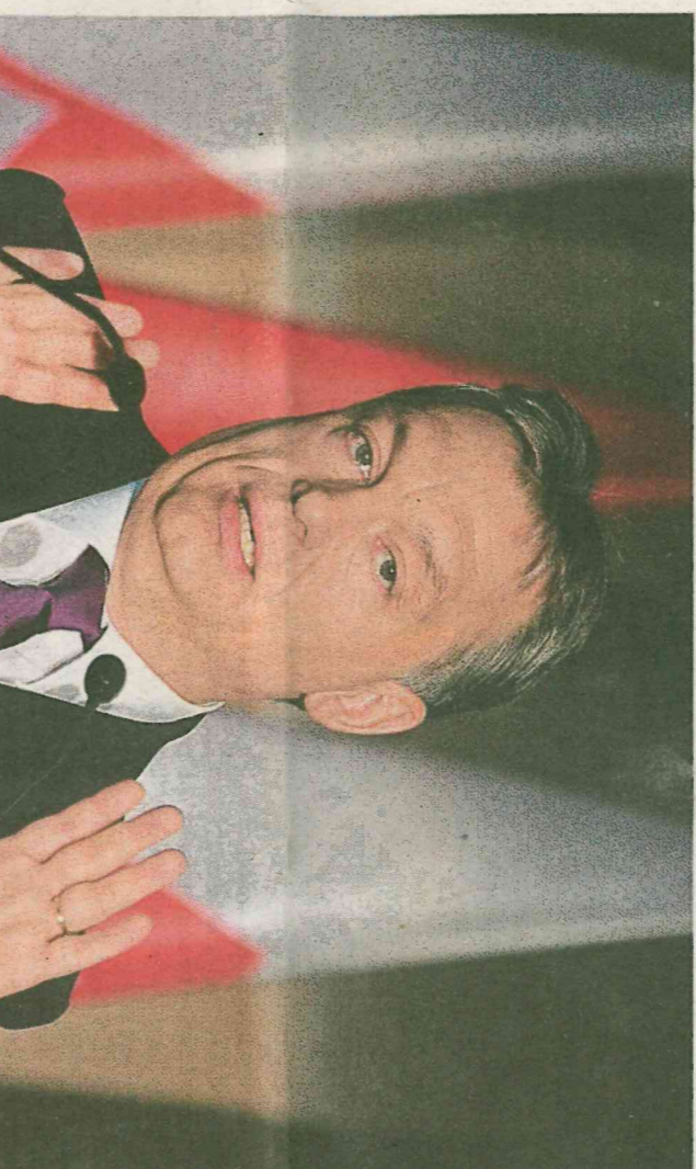
Na nic nečekáme Vláda Viktora Orbána se rozhodla nečekat, až se EU o uprchlích dohodne.

BUDAPEŠŤ Loni to bylo pětadvacet let, kdy se na rakousko-maďarské hranici slavil pád železné opony, která byla symbolicky zrušena 19. srpna 1989 u města Šopron. Včera Maďaři, kteří byli považováni za národ, jenž neprůchodný plot od dělující Východ a Západ přestřihl, oznámili, že postaví na maďarsko-srbské hranici novou železnou oponu. Ta by měla zemi ochránit před přílivem imigrantů do země.